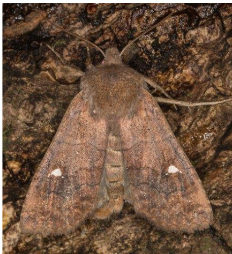
Twee varianten van de Wachtervlinder