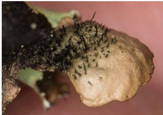
Groot schildmos met detail van de zwarte ciliën aan de onderzijde